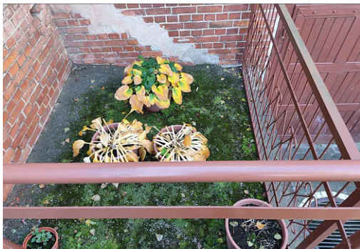
Fot. kącik- wnęka -stan istniejący